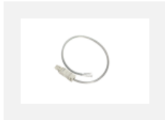
101-0013, W Transparentes Kabel 3x 0,75 mm, 2000 mm mit Konektor WAGO