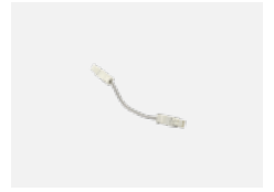
101-0011 Verbindungskabel 3x 0,75 mm, angesetzt mit Konektor WAGO