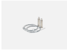
101-0002, N Seilaufhängung 2000 mm, 2 Seile