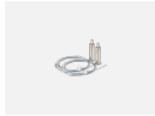
101-0008, N Seilaufhängung 6000 mm, 2 Seile