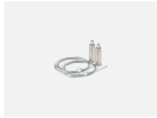
101-0007, N Seilaufhängung 4000 mm, 2 Seile