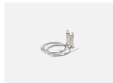
101-0008, N Seilaufhängung 6000 mm, 2 Seile