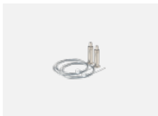
101-0002, N Seilaufhängung 2000 mm, 2 Seile