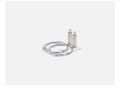
101-0008, N Seilaufhängung 6000 mm, 2 Seile