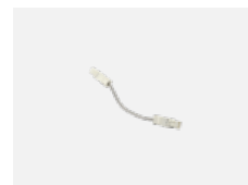
101-0011 Verbindungskabel 3x 0,75 mm, angesetzt mit Konektor WAGO