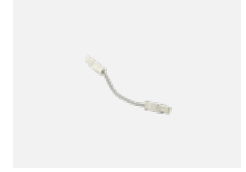
101-0011 Verbindungskabel 3x 0,75 mm, angesetzt mit Konektor WAGO