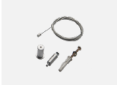
00-00300, N Seilaufhängung 2000mm