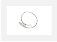
101-0013, W Transparentes Kabel 3x 0,75 mm, 2000 mm mit Konektor WAGO