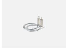
101-0007, N Seilaufhängung 4000 mm, 2 Seile