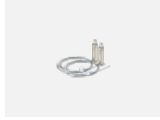
101-0008, N Seilaufhängung 6000 mm, 2 Seile