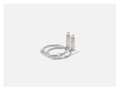
101-0008, N Seilabhängung 6000 mm, 2 Seile