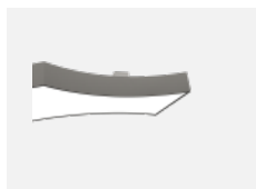
101-0001, B Distanzteile für Leuchten