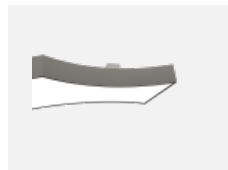
101-0001, S Distanzteil für Leuchten