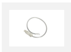
101-0013, W Transparentes Kabel 3x 0,75 mm, 2000 mm mit Konektor WAGO