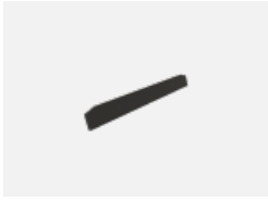
100-0001, S Endkappe - Metall