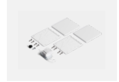
00-20103, S 2xEndkappe - Kunststoff, Klemmleiste 5-polig, Kabeldurchführung; Lipo80/Lina80