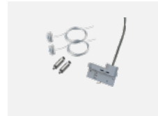
00-51300, S Set für Aufhängung in 3Ph-Schiene für nicht dimmbare Leuchten