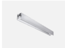
00-21301, S Lipo80-S, Lina80-S - angehängtes Profil mit 3- phasen Schiene; l=2242mm