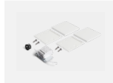
00-20101, S 2xEndkappe - Metall, Klemmleiste 5-polig, Kabeldurchführung; Lipo80/Lina80