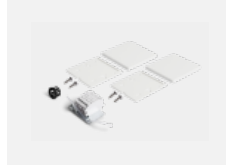
00-20101, S 2xEndkappe - Metall, Klemmleiste 5-polig, Kabeldurchführung; Lipo80/Lina80