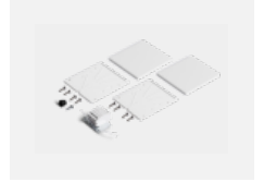
00-20103, S 2xEndkappe - Kunststoff, Klemmleiste 5-polig, Kabeldurchführung; Lipo80/Lina80