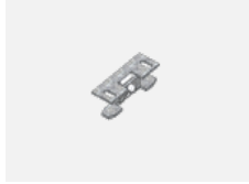
00-00600, F Deckenhalter für Leuchten 132-5xxK, 04-2000x, 05-2000x, 09-200x - 1 Stck.