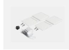
00-20101, S 2xEndkappe - Metall, Klemmleiste 5-polig, Kabeldurchführung; Lipo80/Lina80