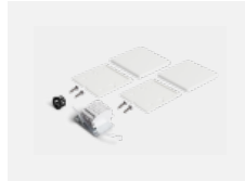
00-20101, W 2xEndkappe - Metall, Klemmleiste 5-polig, Kabeldurchführung; Lipo80/Lina80