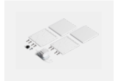
00-20103, W 2xEndkappe - Kunststoff, Klemmleiste 5-polig, Kabeldurchführung; Lipo80/Lina80