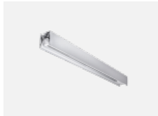
00-21300, W Lipo80-S, Lina80-S - angehängtes Profil mit 3- phasen Schiene; l=1122mm