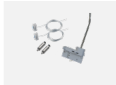
00-51300, W Set für Aufhängung in 3Ph-Schiene für nicht dimmbare Leuchten