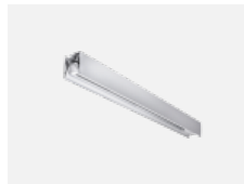
00-21300, W Lipo80-S, Lina80-S - angehängtes Profil mit 3- phasen Schiene; l=1122mm