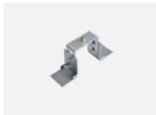
00-20900, F Satz für Einbau des Pendelprofils