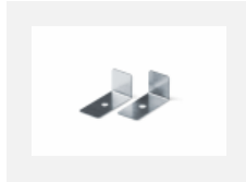
00-01200, F Zubehör für Demontage El. Modules