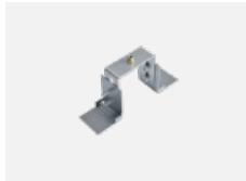
00-20900, F Satz für Einbau des Pendelprofils