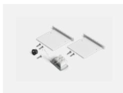
00-00100, W 2xEndkappe - Metall, Klemmleiste 3-polig, Kabeldurchführung; Lipo80