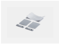
00-00200, N Direkter Verbinder