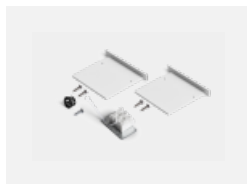
00-00100, W 2xEndkappe - Metall, Klemmleiste 3-polig, Kabeldurchführung; Lipo80