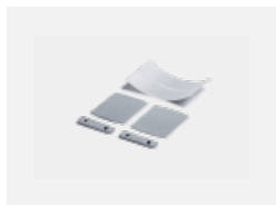
00-00200, N Direkter Verbinder