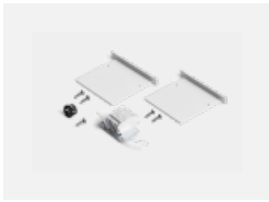
00-00101, W 2xEndkappe - Metall, Klemmleiste 5-polig, Kabeldurchführung; Lipo80