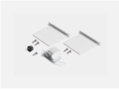
00-00101, B 2xEndkappe - Metall, Klemmleiste 5-polig, Kabeldurchführung; Lipo80