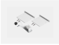
00-00100, W 2xEndkappe - Metall, Klemmleiste 3-polig, Kabeldurchführung; Lipo80