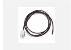
00-00500 Kabel für Notbeleuchtung XX- XXXX-20