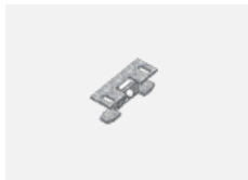
00-00600, F Deckenhalter für Leuchten 132-5xxK, 04-2000x, 05-2000x, 09-200x - 1 Stck.