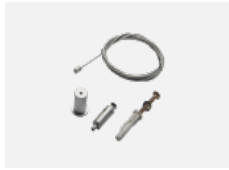
00-00300, N Seilauflösung 2000mm