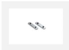
04-00200, N Direkter Verbinder