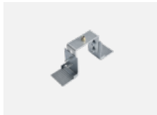
04-20900, F Satz für Einbau des Pendelprofils