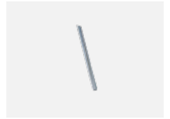
00-00358, K Kabel 3x0,75 4000mm