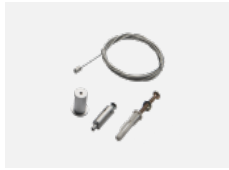
00-00300, N Seilaufhängung 2000mm