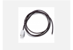
00-00501 Kabel für Notbeleuchtung XX- XXXX-40