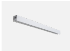
04-21303, W angehängtes Profil mit 3- phasen Schiene; l=1122mm