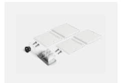
04-20102, W 2xEndkappe - Kunststoff, Klemmleiste 3-polig, Kabeldurchführung