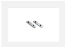
04-00200, N Direkter Verbinder