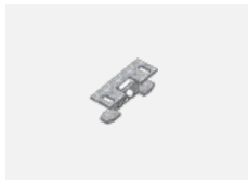
00-00600, F Deckenhalter für Leuchten 132-5xxK, 04-2000x, 05-2000x, 09-200x - 1 Stck.