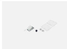
04-20100, W 2xEndkappe - Metall, Klemmleiste 3-polig, Kabeldurchführung