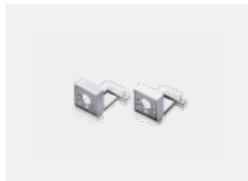
00-20700, W Wandhalter (2 Stk) Lipo/Lina