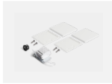
04-20103, S 2xEndkappe - Kunststoff, Klemmleiste 5-polig, Kabeldurchführung