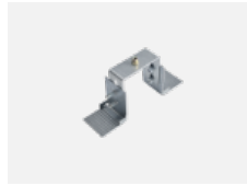
04-20900, F Satz für Einbau des Pendelprofils