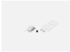
04-20101, S 2xEndkappe - Metall, Klemmleiste 5-polig, Kabeldurchführung