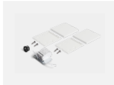
04-20103, W 2xEndkappe - Kunststoff, Klemmleiste 5-polig, Kabeldurchführung