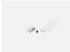
04-20101, W 2xEndkappe - Metall, Klemmleiste 5-polig, Kabeldurchführung