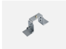
04-20900, F Satz für Einbau des Pendelprofils