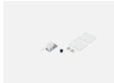
04-20100, W 2xEndkappe - Metall, Klemmleiste 3-polig, Kabeldurchführung