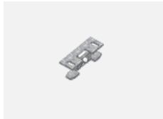
00-00600, F Deckenhalter für Leuchten 132-5xxK, 04-2000x, 05-2000x, 09-200x - 1 Stck.