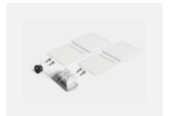
04-20102, W 2xEndkappe - Kunststoff, Klemmleiste 3-polig, Kabeldurchführung