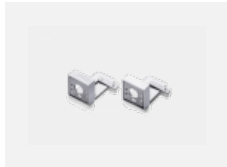
00-20700, W Wandhalter (2 Stk) Lipo/Lina