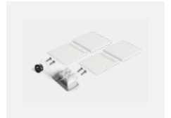
04-20102, W 2xEndkappe - Kunststoff, Klemmleiste 3-polig, Kabeldurchführung