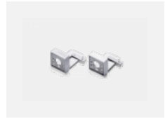
00-20700, W Wandhalter (2 Stk) Lipo/Lina