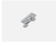
00-00600, F Deckenhalter für Leuchten 132-5xxK, 04-2000x, 05-2000x, 09-200x – 1 Stck.