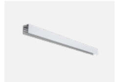
04-21303, W angehängtes Profil mit 3- phasen Schiene; l=1122mm