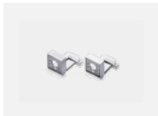
00-20700, W Wandhalter (2 Stk) Lipo/Lina