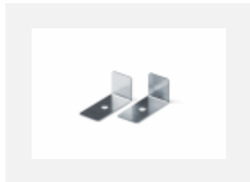
04-01200, F Zubehör für Demontage El. Modules