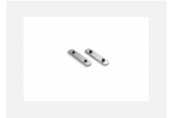
04-00200, N Direkter Verbinder