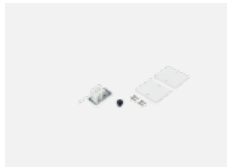
04-20100, W 2xEndkappe - Metall, Klemmleiste 3-polig, Kabeldurchführung