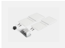
04-20102, W 2xEndkappe - Kunststoff, Klemmleiste 3-polig, Kabeldurchführung