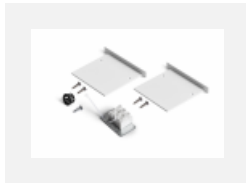
04-00100, B 2xEndkappe - Metall, Klemmleiste 3-polig, Kabeldurchführung