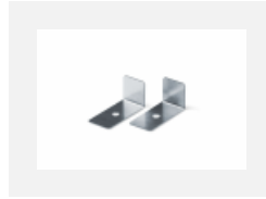
04-01200, F Zubehör für Demontage El. Modules