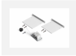
04-00100, S 2xEndkappe - Metall, Klemmleiste 3-polig, Kabeldurchführung