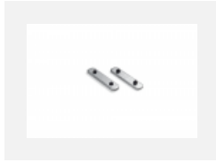
04-00200, N Direkter Verbinder