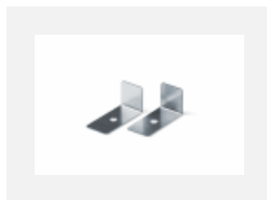
04-01200, F Zubehör für Demontage El. Modules