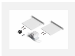
04-00101, W 2xEndkappe - Metall, Klemmleiste 5-polig, Kabeldurchführung