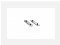
04-00200, N Direkter Verbinder