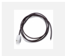
00-00501 Kabel für Notbeleuchtung XX- XXXX-40