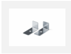
04-01200, F Zubehör für Demontage El. Modules