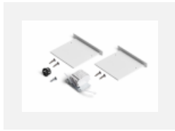
04-00101, W 2xEndkappe - Metall, Klemmleiste 5-polig, Kabeldurchführung