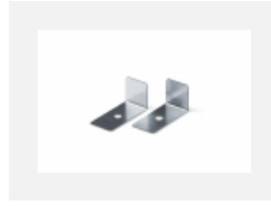
04-01200, F Zubehör für Demontage El. Modules