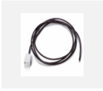
00-00500 Kabel für Notbeleuchtung XX- XXXX-20