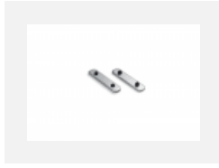
04-00200, N Direkter Verbinder