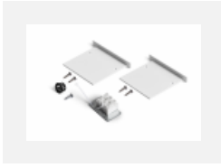
04-00100, W 2xEndkappe - Metall, Klemmleiste 3-polig, Kabeldurchführung