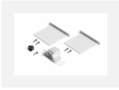
04-00101, B 2xEndkappe - Metall, Klemmleiste 5-polig, Kabeldurchführung