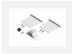
04-00101, W 2xEndkappe - Metall, Klemmleiste 5-polig, Kabeldurchführung